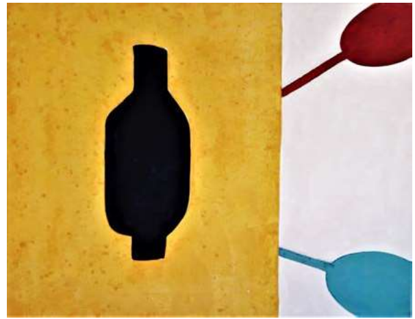
Afb. 3 Forza, acryl-olieverf op doek 70x90cm, 2013.

Het gesprek komt op Mondriaan, omdat hij zich qua intentie verwant voelt aan deze schilder. Maar hij voelt, in het streven naar het minimale, ook het spanningsveld waarin hij dan werkzaam is. Er is het gevaar voor verstarring. Het kan té onpersoonlijk worden. 'Bij Mondriaan werd het op den duur zó objectief; bijna onmenselijk.' Willem de Koning, met zijn expressionistische werk, schiet wat hem betreft weer door naar de andere kant. 'Ik wil er graag tussenin blijven, universeel en objectief en toch niet onpersoonlijk. Als dat lukt, dan stijgt het beeld boven zichzelf uit. In mijn optiek krijgt het dan een sacrale uitstraling.' (Afbeelding 6.) ||