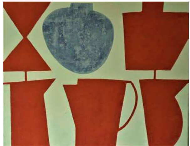
Afb. 5 A Posta, acryl-olie op doek, 100x80cm, 2018.