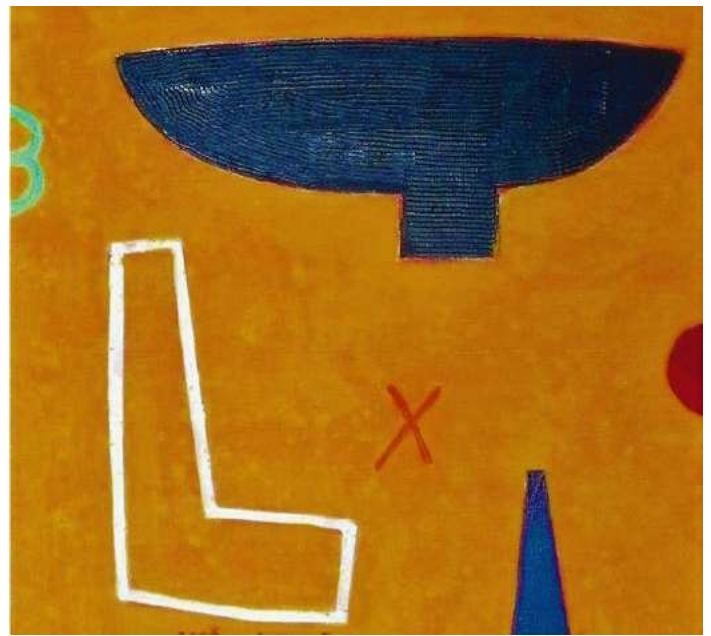
Afb.1 Consonanza, acryl-olieverf op paneel, 40x39cm. 2006.

'Het schilderen, het werkproces is voor mij mediteren. Dat heb ik moeten ontwikkelen, die meditatieve werkhouding. Ik studeerde van 1971 tot 1976 aan de Rietveld Academie in Amsterdam en aan de Academie Minerva in Groningen. Ik werkte aanvankelijk impulsiever, meer gestuwd, richting Cobra, of de materieschilders, zoals toen erg in was. Maar geleidelijk is in mij de behoefte ontstaan om daar iets tegenover te stellen.' Van 1987 tot 1989 studeerde hij bij de Werkgroep Kunsten aan de Vrije Hogeschool en met name de lessen bij Benno Sloots zorgden voor een omslag. 'Ik heb mezelf ook wel beet moeten nemen, mezelf