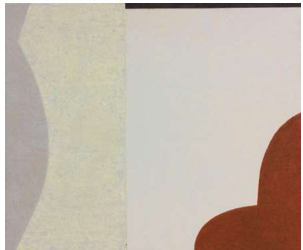
Afb. 6 Zonder Titel. acryl-olie op doek, 50x60cm, 2020.