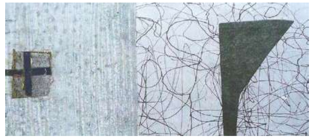
Afb. 4 Zonder Titel, collage op karton, 7x15cm, 2017.