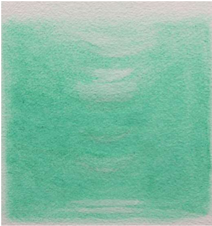
Afb. 2: Malachiet op papier, 2019

zeggen: het is voor soldaten die de oorlog in gaan ongelooflijk belangrijk dat ze innerlijk het beeld meedragen van de vrouw! En ik besepte: hoe kunnen wij in ons handelen in de wereld die reinheid, die reine liefde met ons meedragen en vormgeven?