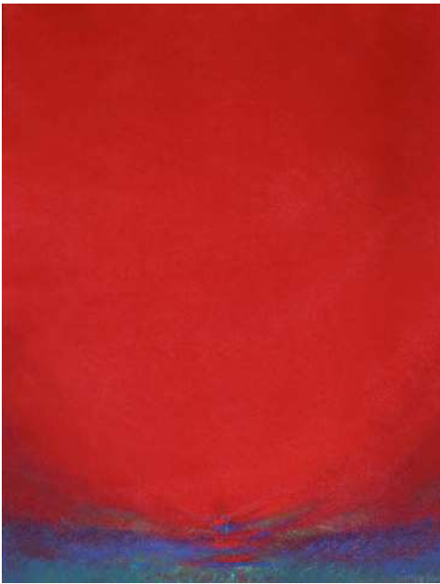
Afb. 4: Paasrood, pastel, 2012.

kerder! Dat je denkt: het kan écht niet verder, donkerder kan ik het niet maken, het kan niet meer zeer doen dan dit! En het was bij die voor het eerst dat ik een moment beleefde, waarop zich dat volkomen omkeerde, en dat zwart ineens warm werd, dragend. Uithouden totdat je door dat gebied heentrekt. Je brengt licht in de duisternis. En dan ... ontmoet je een totaal andere wereld. Dan komt er leven in het zwart. De ruimte begint te klinken. Ik ben daardoorheen getrokken, en aangekomen ... in een dragende, een volkomen god-vader wereld. Ja, het gebeurde onder mijn handen, het gebeurt altijd onder mijn handen!