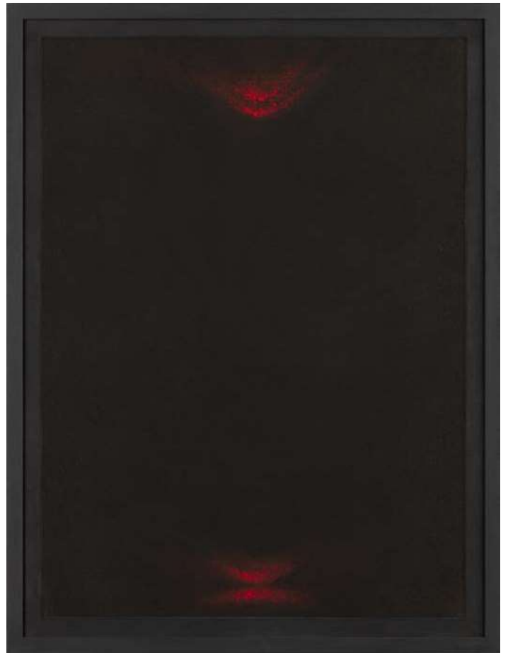
Afb.3: Pastelkrijt, 2012.

Bij het malachiet richt ze zich op iets buiten haar. Vaak ook begint ze binnen. Zo ontstond plotseling in haar een gevoel van immense verlatenheid. Ze tastte dat gevoel innerlijk af en zocht daar materialen bij om dat vorm te geven. Ze nam zwart pastel. 'Dan komt er een proces op gang tussen mij en de stoffen, de materialen. Ik breng mijn aandacht in dat gevoel, ik wil dat schilderen.' Op onze vraag wat de bron is van dat gevoel dat haar tot dat zwart brengt, zegt ze: 'Het is niet een persoonlijke emotie van oh, wat voel ik me alleen, of depressief. Het gevaar is dan dat men een psychologische verklaring zoekt. Maar het is veel groter, existentiëler! Het is intens de werkelijkheid, niet alleen voor mij persoonlijk. Het kan niet anders. Het is een deel van onze ontwikkelingsweg. Ik las een voordracht van Steiner over de "vernietigingshaard". Een mens moet zijn ik ontwikkelen in de confrontatie met de krachten van het kwaad in hem. En als je daar niet bij blijft, als je daar niet in gaat, en die krachten gaan de wereld in, in plaats van dat je ze aangaat vanbinnen, dan ontstaat het kwaad in de wereld. Een belangrijk thema voor mij is de oorlog, en de Jodenvervolging, de Shoah. Dan denk ik: ah, zit dat zo! Weet je, dat is wat ik zie, dat je het kwaad niet daar houdt waar het moet zijn, waar het noodzakelijk is, maar dat je het ongecontroleerd naar buiten laat gaan, dat is iets wat mij heel erg raakt, dat is de stroom waarin ik aan het zoeken ben.'