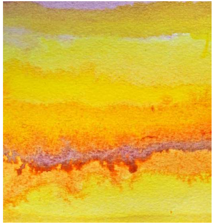
Afb. 1: Zwavelgeel, inkt, 2019)

‘Het is een tasten naar binnen, een tasten naar buiten, in de ontmoeting met de materialen ontstaan de beelden’