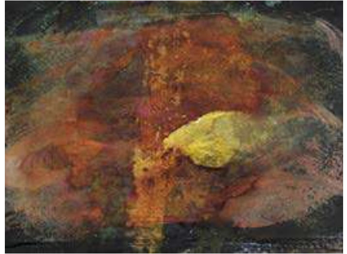
Afb. 4 - Ik zag en zie (Apocalyps)