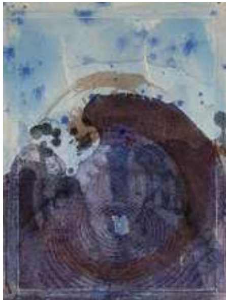
Afb. 2 - Gelouterd en gereed tot stijgen naar de sterren (Divina Commedia)