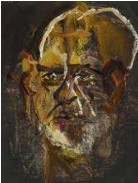
Afb. 1 - Portret TBS-ers uit de Pompe Kliniek