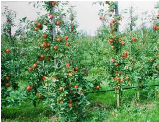
Sterke en zwakke boom naast elkaar

levenskrachten treden schimmels op bij planten. Een thee van heermoes ontlast de aarde van de overtollige maankracht, het water wordt zijn overdragende kracht ontnomen en de aarde krijgt meer aardseheid, zodat zij niet een grotere maaninvloed opneemt.”